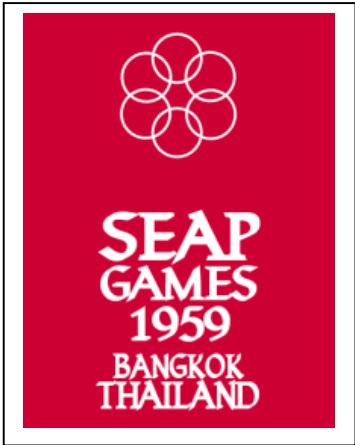
រូបសញ្ញាកីឡាឧបទ្វីបអាស៊ីអាគ្នេយ៍ ប្រើក្នុងការប្រកួតលើកទី១ នៅប្រទេសថៃ ឆ្នាំ១៩៥៩

រូបសញ្ញាអាស៊ីអាគ្នេយ៍ត្រូវបានដាក់បង្ហាញក្នុងអំឡុងការប្រកួតកីឡាឧបទ្វីបអាស៊ីអាគ្នេយ៍លើកទី១ ឆ្នាំ១៩៥៩ នៅទីក្រុងបាងកក។ រូបសញ្ញានោះមានរាងជាផ្ចងៗ ដែលតំណាងឱ្យសមាជិកស្ថាបនិកចំនួន៦ ហើយរូបសញ្ញានោះត្រូវបានប្រើរហូតដល់ឆ្នាំ១៩៩៧។ នៅឆ្នាំ១៩៩៩ រូបសញ្ញាផ្ចងៗ បានកើនឡើងដល់ចំនួន១០។ នៅឆ្នាំ២០១១ គេបានដាក់បញ្ចូលប្រទេសទីម័រខាងកើត ហេតុនេះ បច្ចុប្បន្នរូបសញ្ញាផ្ចងៗនេះបានឡើងដល់ចំនួន១១។